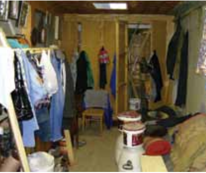
Arbeitsraum in der Lazaruskirche

Die ersten Schritte zur Arbeit in der Lazarus Kirche waren lang und mühsam. Um in einer orthodoxen Kirche arbeiten oder in irgendeiner Weise tätig zu werden, muss man von einem Priester den sogenannten