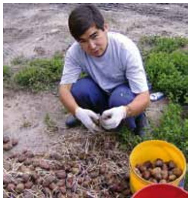
Bei der Kartoffelernte

aus einem zylinderförmigen Bauch und aus einer kleinen Scheibe, die als Deckel oben auf den Bauch gesetzt wird. Jede Scheibe wird gestempelt: dieser Stempel zeigt in altgriechischer Schrift „Christos voskrese, voistinu voskrese“ (Christus ist auferstanden, er ist wahrhaftig auferstanden). Bevor jedes Blech